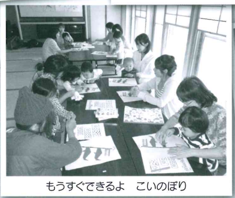
もうすぐできるよ こいのぼり