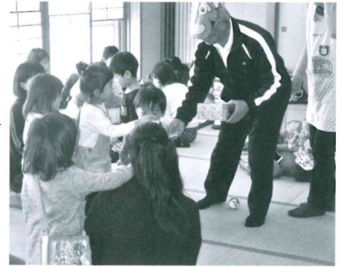
節分豆まき、鬼さんからプレゼント