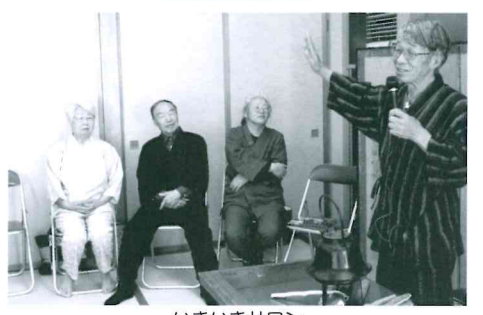
いきいきサロン「天童とんとん昔話の会」の皆さん