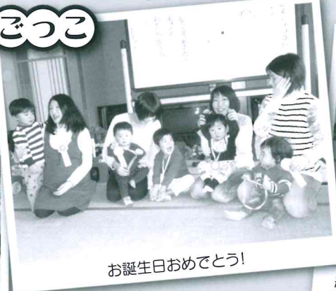
お誕生日おめでとう!