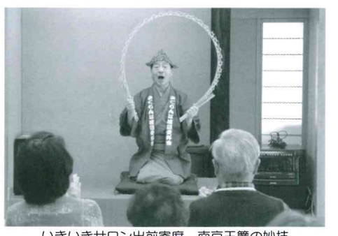
いきいきサロン出前寄席 南京玉簾の妙技