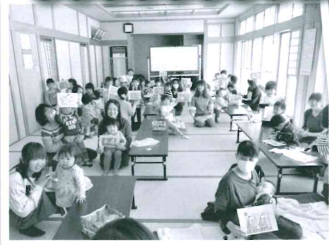
かわいいおひな様ができちゃ!!