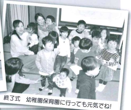
終了式 幼稚園保育園に行っても元気でね!