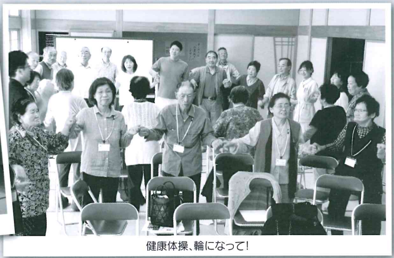
健康体操、輪になって!