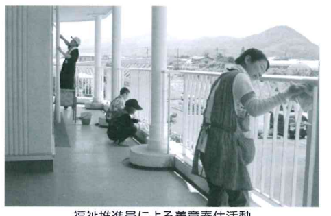
福祉推進員による善意奉仕活動 特別養護老人ホーム「あこがれ」清掃