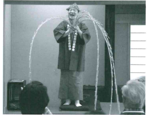
いきいきサロン 出張寄席