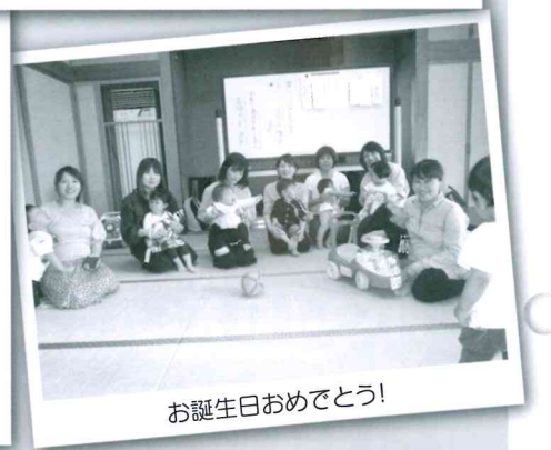
お誕生日おめでとう!