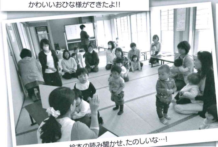
絵本の読み聞かせ、たのしいな…!