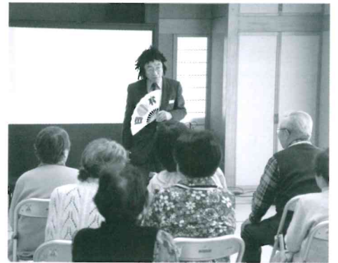
いきいきサロン 交通安全教室